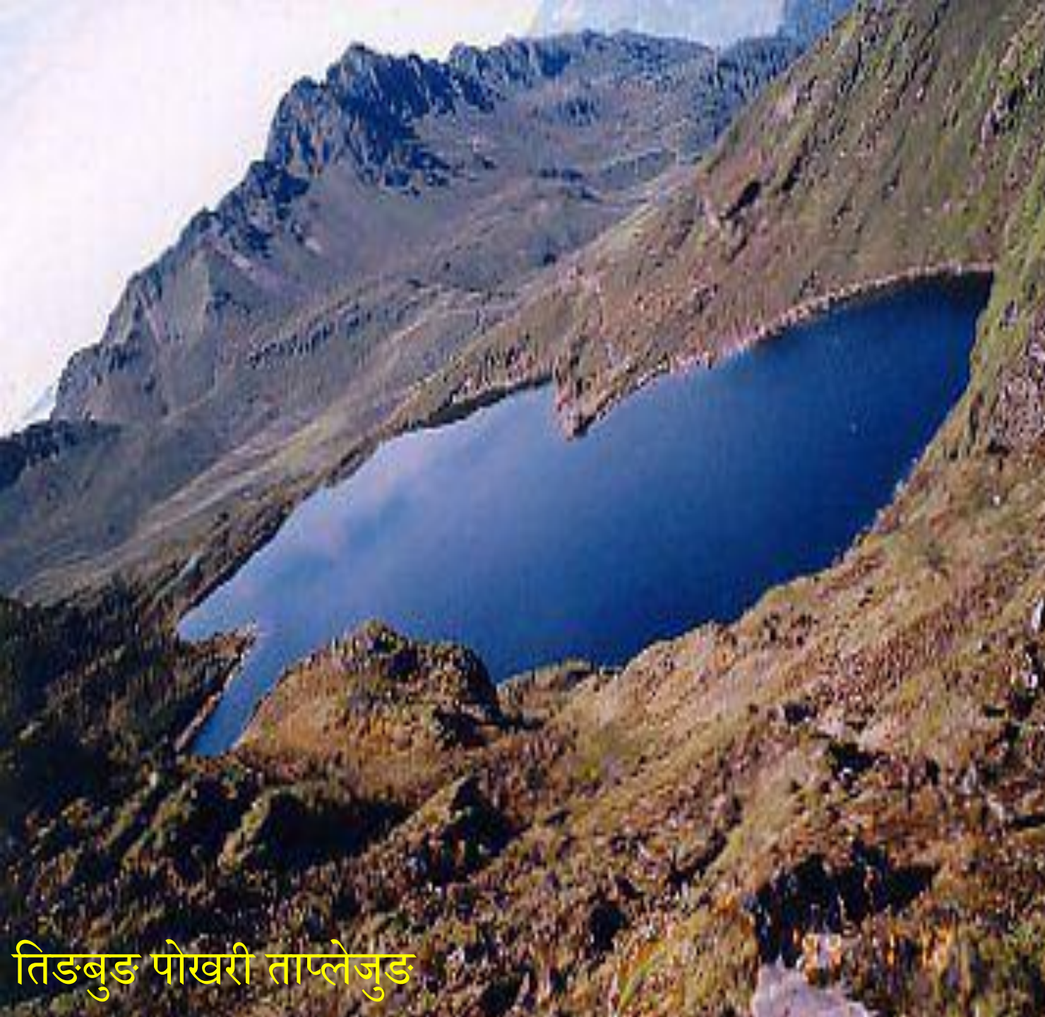
तिडबुड पोखरी ताप्लेजुड